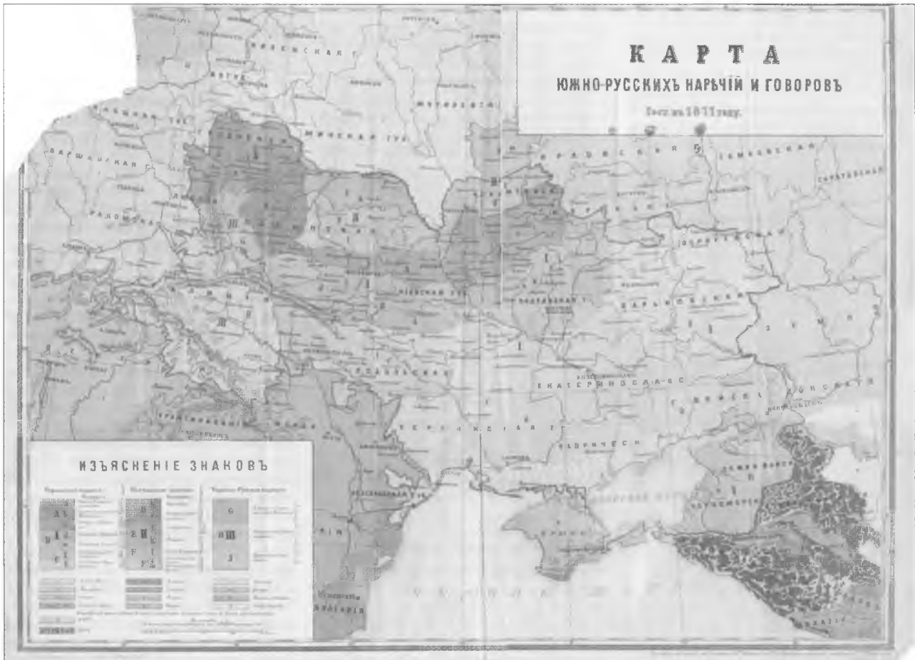
Мапа південноруських наріч і говірок П. Чубинського і К. Михальчука (1871)

Ця карта була підготовлена етнографом Павлом Чубинським (автором тексту українського національного гімну) та мовознавцем Костем Михальчуком. Опублікована у виданнях Південно-західного відділу Російського імператорського географічного товариства. Нескладно здогадатися, що окреслені червоною лінією «південноруські наріччя та говірки» позначають територію домінування української мови на середину ХІХ століття (див. зворот обкладинки).