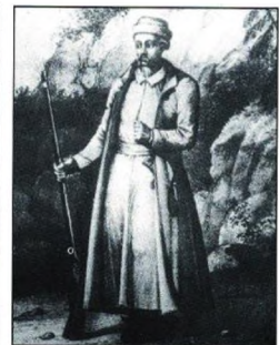
Soldan sağa: Bir Kozak askeri, Kozak topçusu ve topu, Kozak ihtiyat askeri.