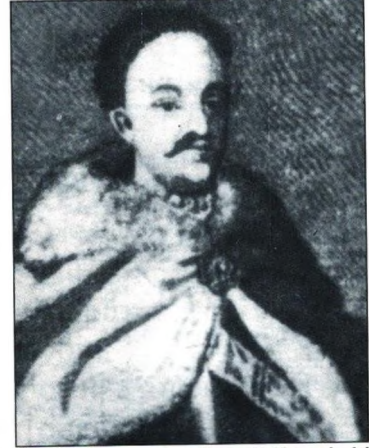
Ünlü Leh komutanı Jan Sobieski, Kamenice'yi geri alma teşebbüsüne cesaret edememişti.

Leh tarihlerinde, at üzerinde bir Yeniçeri Ağası.