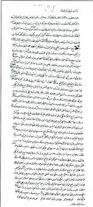
IV. Mehmed'in, Petro Doroshenko'ya gönderdiği berat.

bu cesareti, Osmanlı Devleti'nin, Sultan II. Osman (1618-1622) dönemindeki gibi zayıf olduğu kanaatinden kaynaklanıyordu. Ancak, İstanbul'dan çok sert bir tepki geldi. Eğer tecavüz durdurulmazsa, savaş açılacaktı.