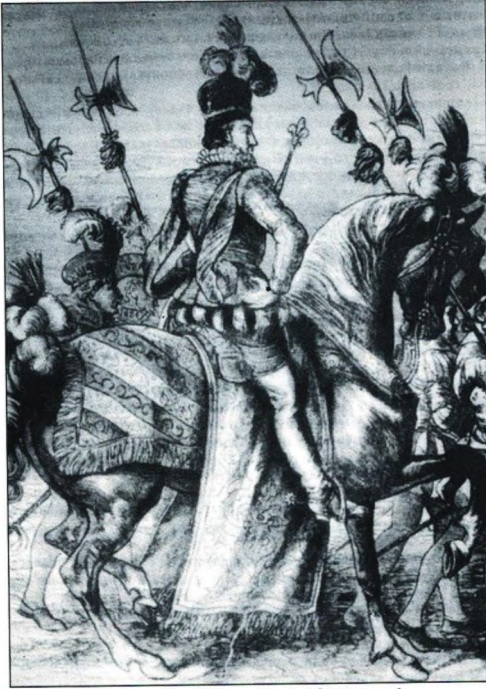
Lehistan Kralı Ukrayna harekâtı sırasında.

merkez şehri olan Kamenetz-Podolsk kalesi o sırada Lehistan işgalindeydi. Türk ordusu, Dobruca-İsakçı-Yaş-Hotin üzerinden, bu şehre ulaştı. Yolda, Ukrayna Hatmanı Dorosenko ve Kırım Hanı Selim Giray , kuvvetleriyle beraber gelip orduya iltihak ettiler.