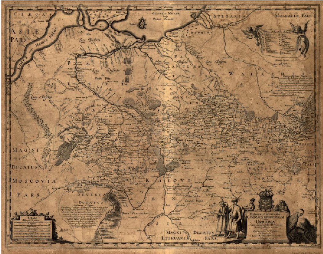
Giyom Levasser de Boplan'nın 17. Yüzyılda Ukrayna Haritası