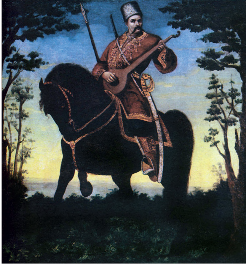
Kazak Mamay (Sanatsal Ukrayna Kazağı simgesi)