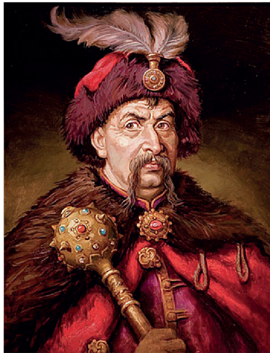
Ukrayna Hatmanı Bogdan Himelnitskiy (hatmanlık dönemi: 1648-1657)