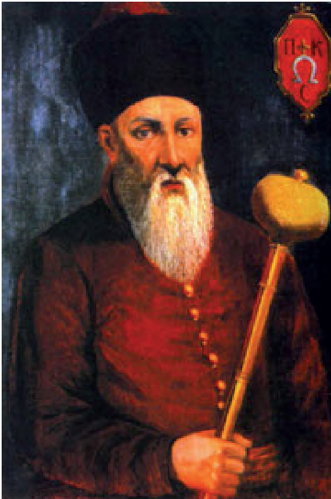
Ukrayna Hatmanı Petro Kanaşeviş-Sahaydaçniy (hatmanlık dönemi: 1614-1622)