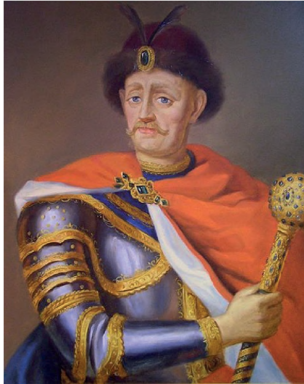
Ukrayna Hatmanı İvan Mazepa (hatmanlık dönemi: 1687-1709)