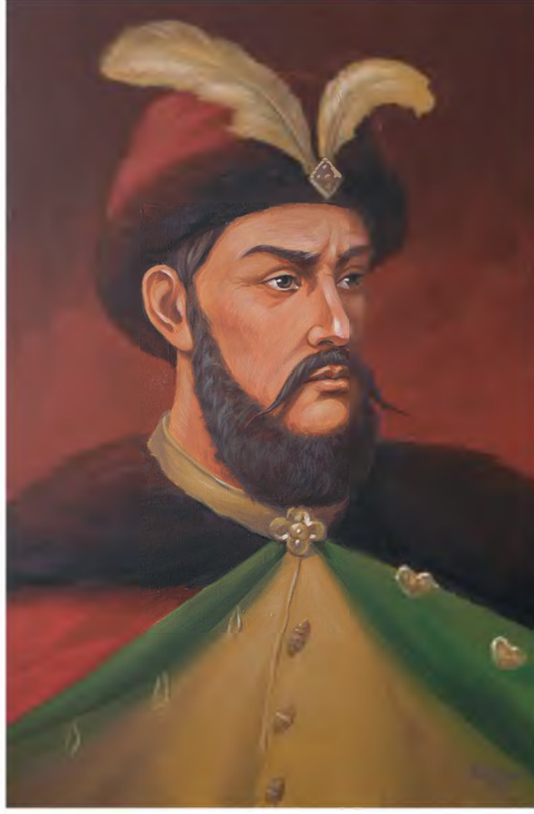
Ukrayna Hatmanı Petro Doroshenko (hatmanlık dönemi: 1665-1676)