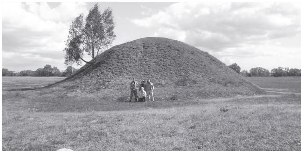
Рис. 5. Курган X ст. поблизу городища селища Норинськ, яке, за археологічними даними, функціонувало з X по XVIII ст.

Володимира Великого. Інакше кажучи, корінні мешканці Овруччини продовжують дотримуватися киеворуської традиції, що пережила тисячоліття.