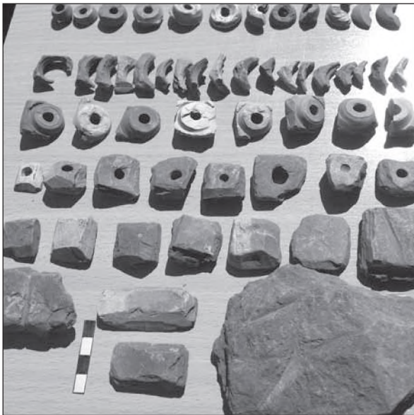
Рис. 2. Рештки виробництва пірофілітових пряслиць з селища-майстерні XI–XIII ст. поблизу с. Нагоряни

відрізняються від селян ні ментальністю, ні способом життя, не платять податків, не підлягають державній службі, користуючись дворянськими привілеями», – писав губернатор. Ці люди говорять по-малоросійськи, однак вони, не зважаючи на бідність, живуть гідно і чисто. В одному з сіл нарахували понад тисячу душ з однаковим прізвиськом, і всі вони вважають себе дворянами. На рапорт губернатора Микола I наклав резолюцію – «Строго изучить!» [3, с. 171, 172].