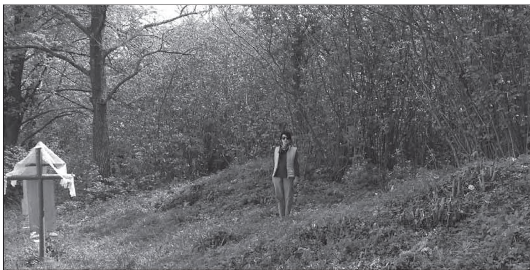
Рис. 4. Сучасні могили поряд із курганами X–XIII ст. на кладовищі с. Желонь, що функціонує з домонгольських часів

На Овруцькому кряжі відомо близько 80 киеворуських курганных могильників. Багато з них до сьогодні використовуються місцевими жителями як традиційні місця поховань. Фактично принаймні частина кладовищ Овруччини функціонує як цвинтарі з часів