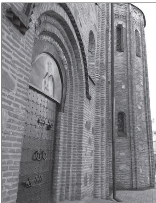
Рис. 1. Стіни храму Святого Василя XII ст. в м. Овруч

В XI–XIII ст. на Овруччині налагодили масове виробництво прясел з пірофіліту – цінного мінералу рожевого кольору (Рис. 2). Пірофілітові прясла були надзвичайно популярні у Східній та Центральній Європі. З Овруча вони поширювалися на північ до Скандинавії, на схід до Уралу, на південь до Криму та Болгарії, на захід в басейни Вісли та Одери. Існує гіпотеза, що овруцькі