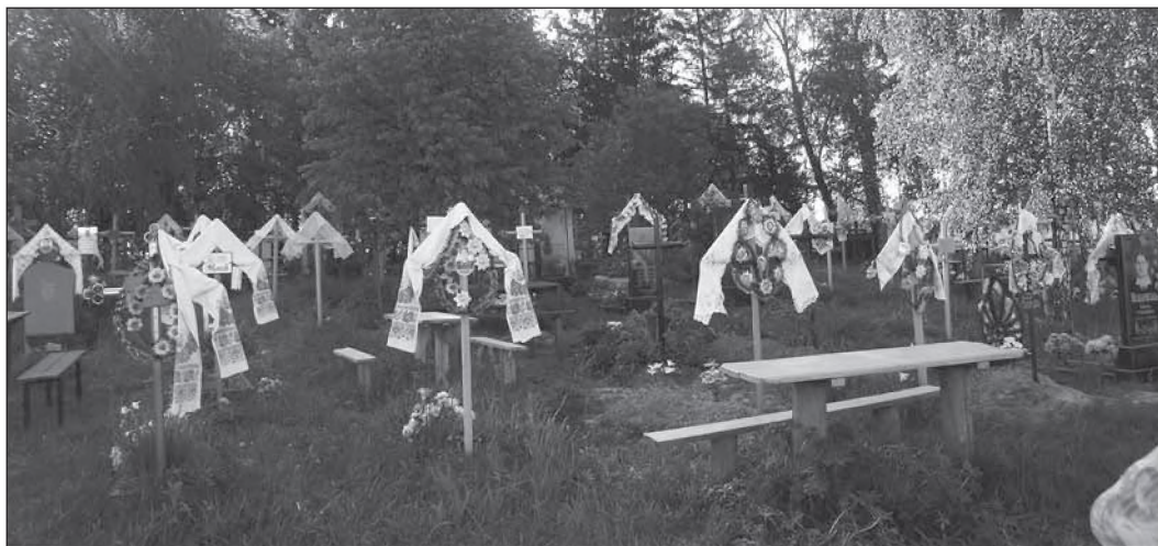
Рис. 3. Шляхетське кладовище між родовими селами околичної шляхти Левковичами та Можарами