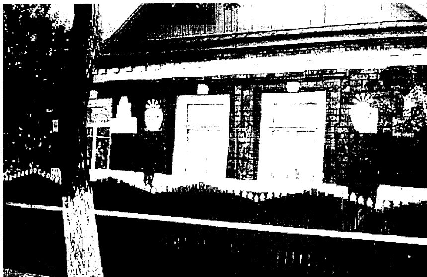
Рис. 1. Розвиток композиції з трьох ромбів, ускладнений варіант якої зустрічається на Поволжі.

до першої кімнати, що виконує функції кухні, їдальні, а також взимку в ній господарі сплять за пічкою (на полатях , на прилавку). Друга кімната розміщується поруч із першою і є більш урочистою.